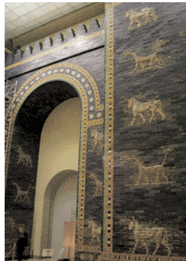
Das Ishtar Tor

Die Wiedervereinigung war für Berlin eine große Herausforderung. Es galt nicht nur zwei völlig unterschiedliche Stadteile miteinander zu verbinden, Berlin musste auch seiner Funktion als Drehscheibe zwischen Ost und West gerecht werden. Neben einem völlig neu geordneten Verkehrssystem mit einem neuen Bahnhof entstand mit Berlin Mitte auch ein neuer Stadtteil, der die Zentren des alten Ostens und des Westens miteinander verbindet. Das bietet dem Besucher den Vorteil, dass er vom symbolträchtigen Brandenburger Tor aus die wichtigsten Sehenswürdigkeiten der preußischen Herrschaft, der ehemaligen DDR, des Westens und auch des postmodernen Berlins besichtigen kann. Beginnen sollte man seinen Streifzug jedoch am besten am Alexanderplatz. Der Brunnen der Freundschaft, die Weltzeituhr und der Fernsehturm (Alex) sind eindrucksvolle Nachlässe des Arbeiter- und Bauernstaates. Aus der gläsernen Kugel des Alex hat man einen Blick auf die prächtige Karl-Marx-Allee mit ihren monumentalen, klassisch