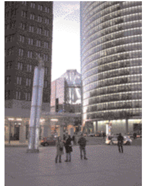
Sony Center مركز سوني

der Potsdamer Platz und das Regierungsviertel mit dem berühmten Reichstagsgebäude und der neuerrichteten, begehbaren Glaskuppel entstanden. Beim durchqueren des Brandenburger Tores entlang der Straße des 17. Juni sieht man schon von weitem die Siegessäule.