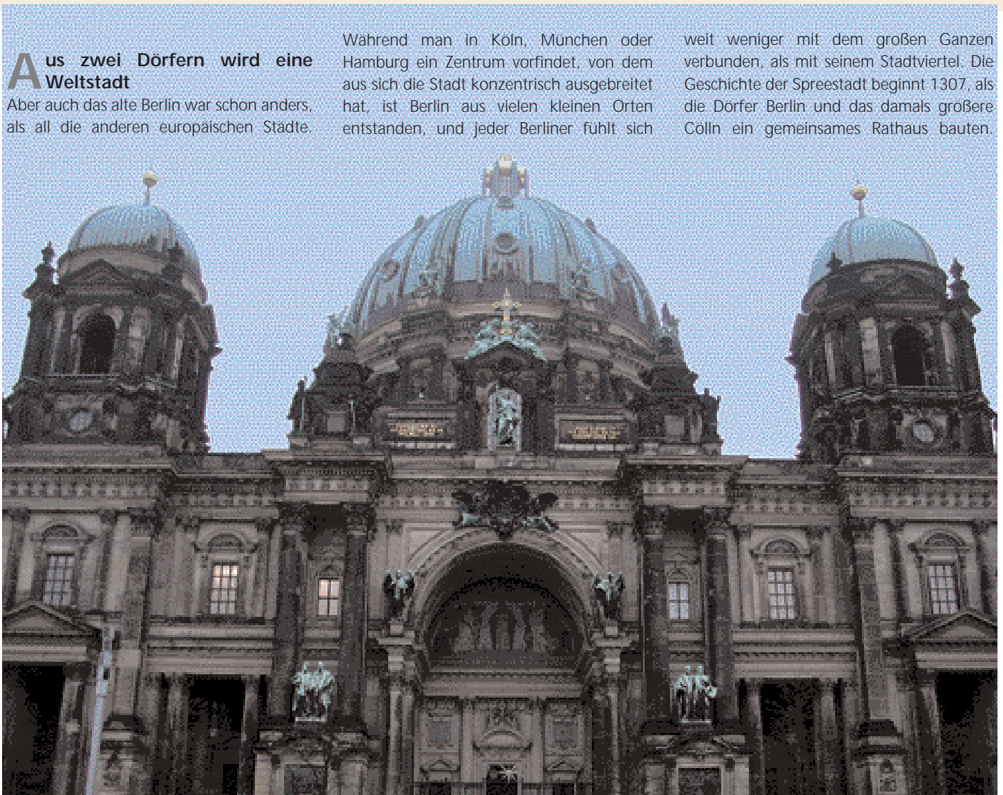
Der Berliner Dom

weit weniger mit dem großen Ganzen verbunden, als mit seinem Stadtviertel. Die Geschichte der Spreestadt beginnt 1307, als die Dörfer Berlin und das damals größere Cölln ein gemeinsames Rathaus bauten. ▶