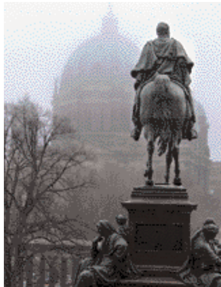
Standbild von Friedrich Wilhelm IV. تمثال فريدريك فيلهلم الرابع