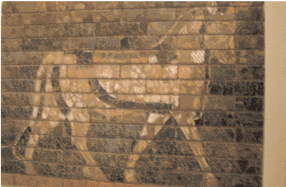
Detailabbildung des Ishtar Tores