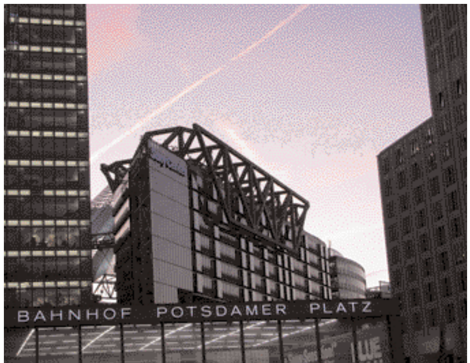
Der Potsdamer Platz

Im so genannten Neuen Museum soll ab dem Jahr 2009 das Ägyptische Museum und die Papyrussammlung mit der berühmten Büste der ägyptischen Königin Nofretete zusammen mit anderen Kunstwerke aus der Zeit des Königs Echnaton zu sehen sein. In den drei Abteilungen des Pergamonmuseums sind Architekturaufbauten, griechische und römische Skulpturen der Antikensammlung, das Vorderasiatische