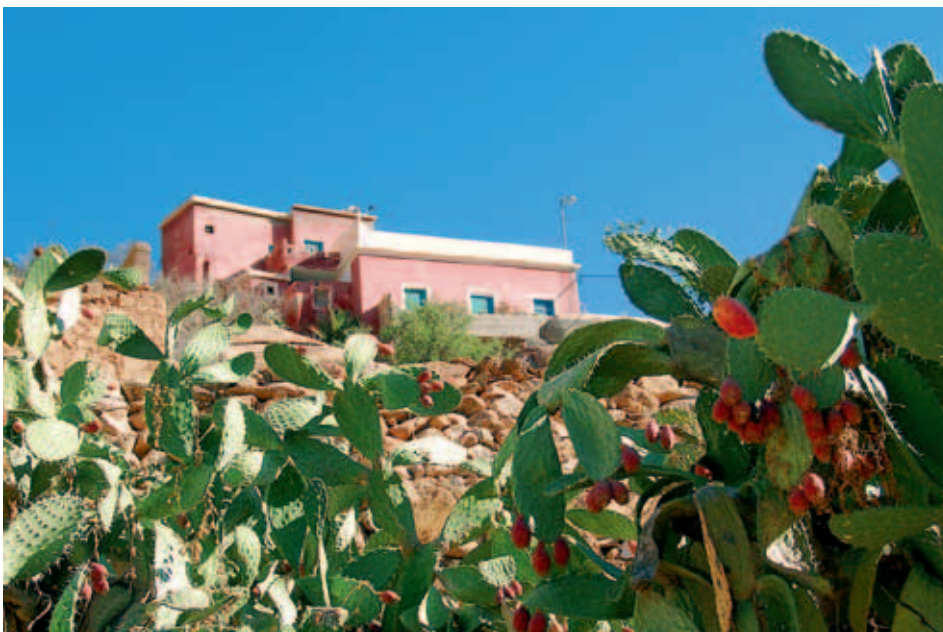
Haus inmitten von Opuntien