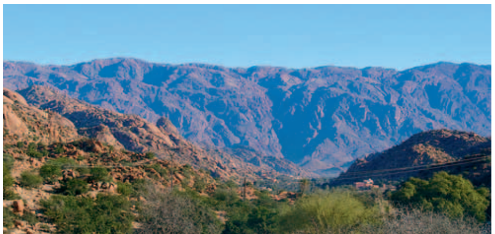
Blick auf das Tal der Ammeln