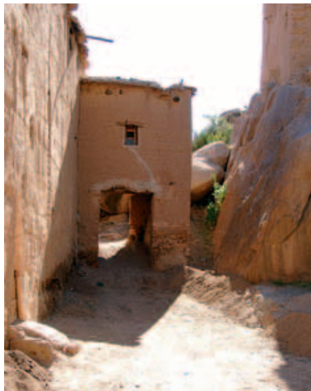
Altes Tor in Tazekka

allen Preisklassen gibt, macht einen Ausflug zum Chapeau de Napoléon, den Painted Rocks und den prähistorische Felszeichnungen, um dann zum nächsten Ziel aufzubrechen. Ich hatte ohnehin Glück, denn ich kam zum Id ul-Adha, dem Opferfest an, durfte mit dem Menschen dort feiern und konnte erleben, wie einer der ansonsten so quirligen marokkanischen Märkte plötzlich ausgestorben war, weil jeder sich fromm in sein Familienleben zurückzog. Für mehrere Tage fuhr kein Bus mehr. So hatte ich die Gelegenheit, das ganze Gebiet, dessen bizarre Sandsteinformen sich über eine Fläche von 30 Quadratkilometer erstrecken, ausgiebig zu erwandern und mich unweigerlich mit der Frage zu beschäftigen, wie diese phantastischen Sandsteinformen entstanden sind. ■