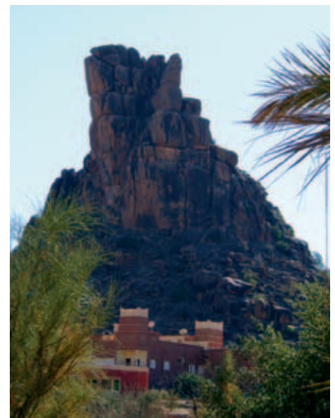
Chapeau Napoleon von Osten