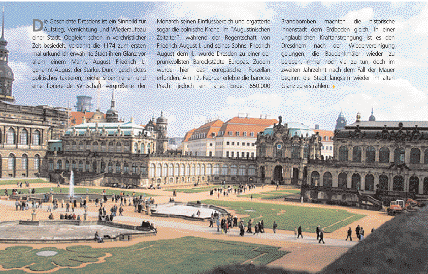
Innenansicht des Zwingers

Brandbomben machten die historische Innenstadt dem Erdboden gleich. In einer unglaublichen Kraftanstrengung ist es den Dresdnern nach der Wiedervereinigung gelungen, die Baudenkmäler wieder zu beleben. Immer noch viel zu tun, doch im zweiten Jahrzehnt nach dem Fall der Mauer beginnt die Stadt langsam wieder im alten Glanz zu erstrahlen. ▶