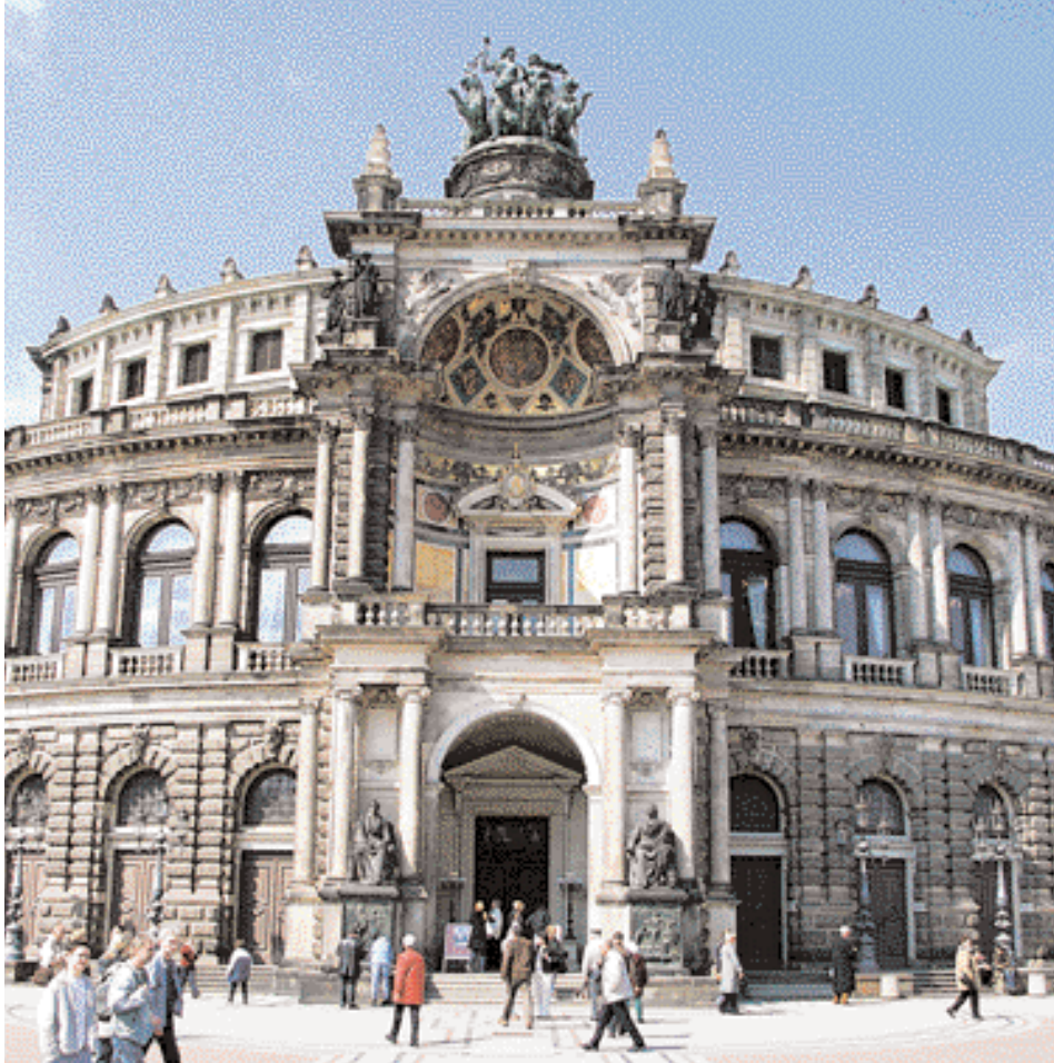
Semperoper mit Quadriga über dem Eingangsportal