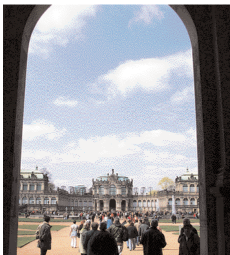
Blick in den Innenhof des Zwingers من داخل زوينغر

Reiseinformationen: Dresden-Werbung und Tourismus GmbH Tel: 0351-49192100 Fax: 0351-49192116 info@dresden-tourist.de www.dresden.de