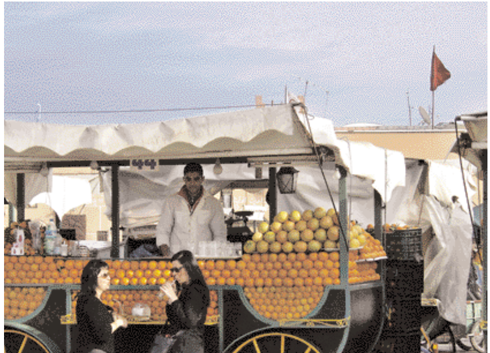
عصير البرتقال الطازج

Die Schlangenbeschwörer am Djemaa el-Fna sind ein Touristenattraktion