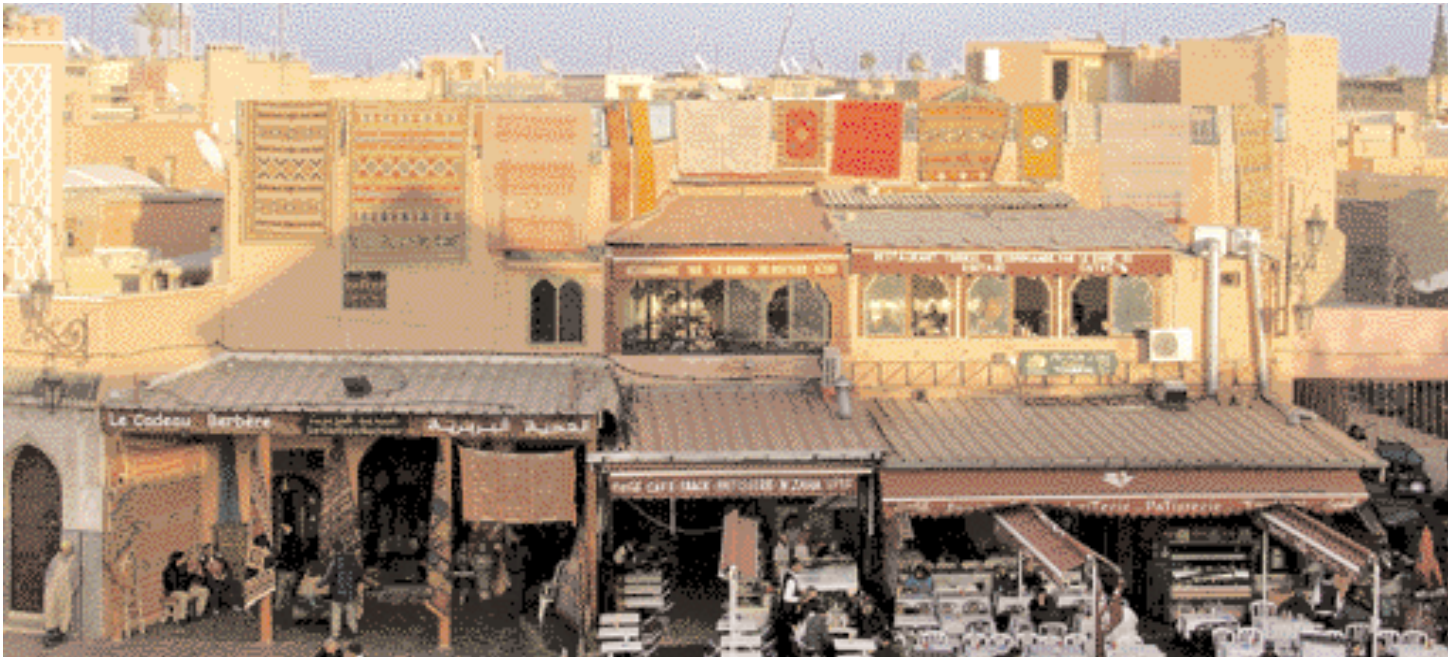
Nachmittagsimpressionen im Herzen von Marrakesch