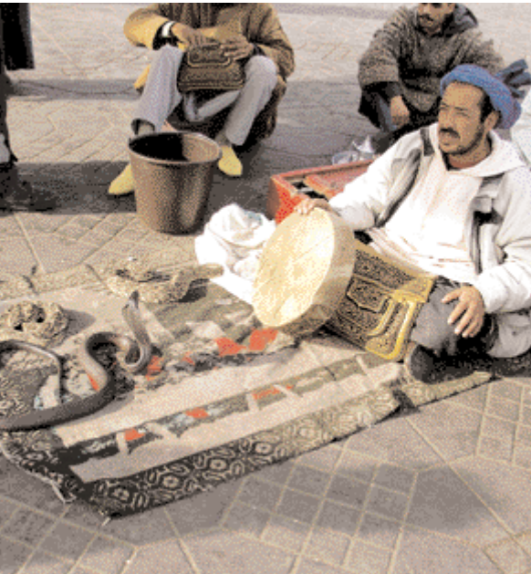
الحاوي في ساحة جامع الفنا

Die Schlangenbeschwörer am Djemaa el-Fna sind ein Touristenattraktion