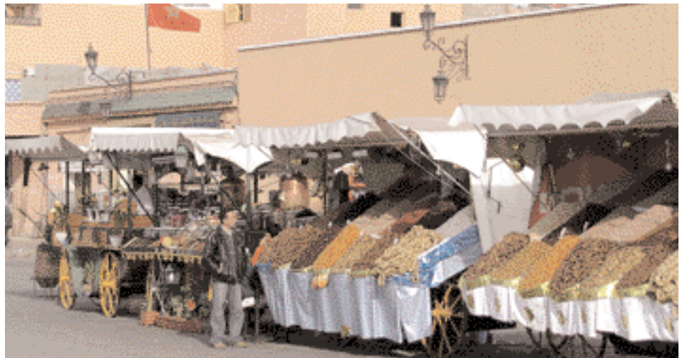
محل في السوق يبيع التمر

Nicht wenige Historiker behaupten, dass das in allen europäischen Sprachen verwendete Wort Markt von Marrakesch stammt und diese Form des Handelens über Spanien nach Europa gelangt ist. Denjenigen, der zum ersten Mal den Souk betritt, mag dieses Gassengewirr zunächst wie ein undurchschaubares Labyrinth erscheinen, aber schon nach ein paar Stunden erkennt man, dass dahinter eine Logik steckt und sieht überall die hilfreichen Wegweiser. Viele der traditionellen Handwerksgassen